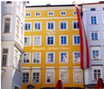
モーツァルトの生家

この度のツアーでは、モーツァルトの生地であり夏の音楽祭でも有名なギルツブルグへの日帰りツアーを、オプションとして行います。(希望者2名以上の場合に実施いたします) 午前 / 列車にてウィーンからギルツブルグに向かいます。 到着後、ミラベル広場まで移動しフリータイム。(昼食は各自) 午後 / ギルツブルグ市内観光(ガイド付き) サウンド・オブ・ミュージックの舞台となったミラベル庭園、モーツァルトの生家、ゲトライデ通り、大聖堂、祝祭劇場等を徒歩で見学。市内観光の後、自由解散。 夕方 / 列車でギルツブルグからウィーンに帰ります。