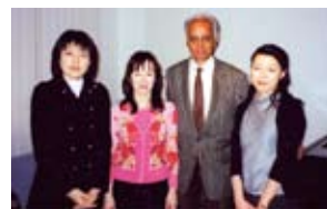
ノエル・フローレス教授と

ウィーン滞在最終日の夜は、ウィーンのアーティストたちや、ウィーン国立音楽大学の教授らを招いて、ウィーン料理の美味しいケラーで打ち上げパーティーをいたします。日頃なかなか会うことの出来ないアーティストたちとの交流をお楽しみください。