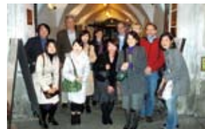
打ち上げパーティーの後で