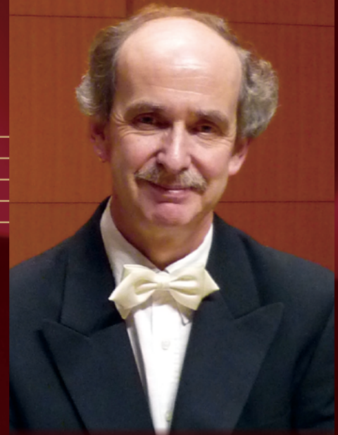
アドリアン・コックス (ピアノ)