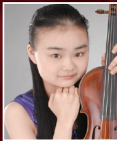
入江真歩 (ヴァイオリン)