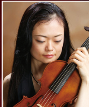
上野美科 (ヴァイオリン)