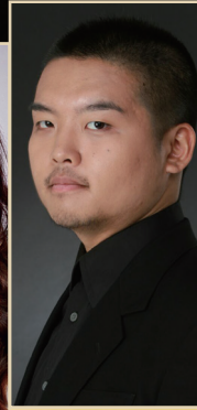
吉留倫太郎 (バリトン)