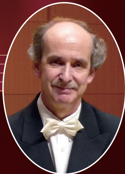
アドリアン・コックス (ピアノ)