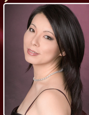
日野妙果 (メゾ・ソプラノ)